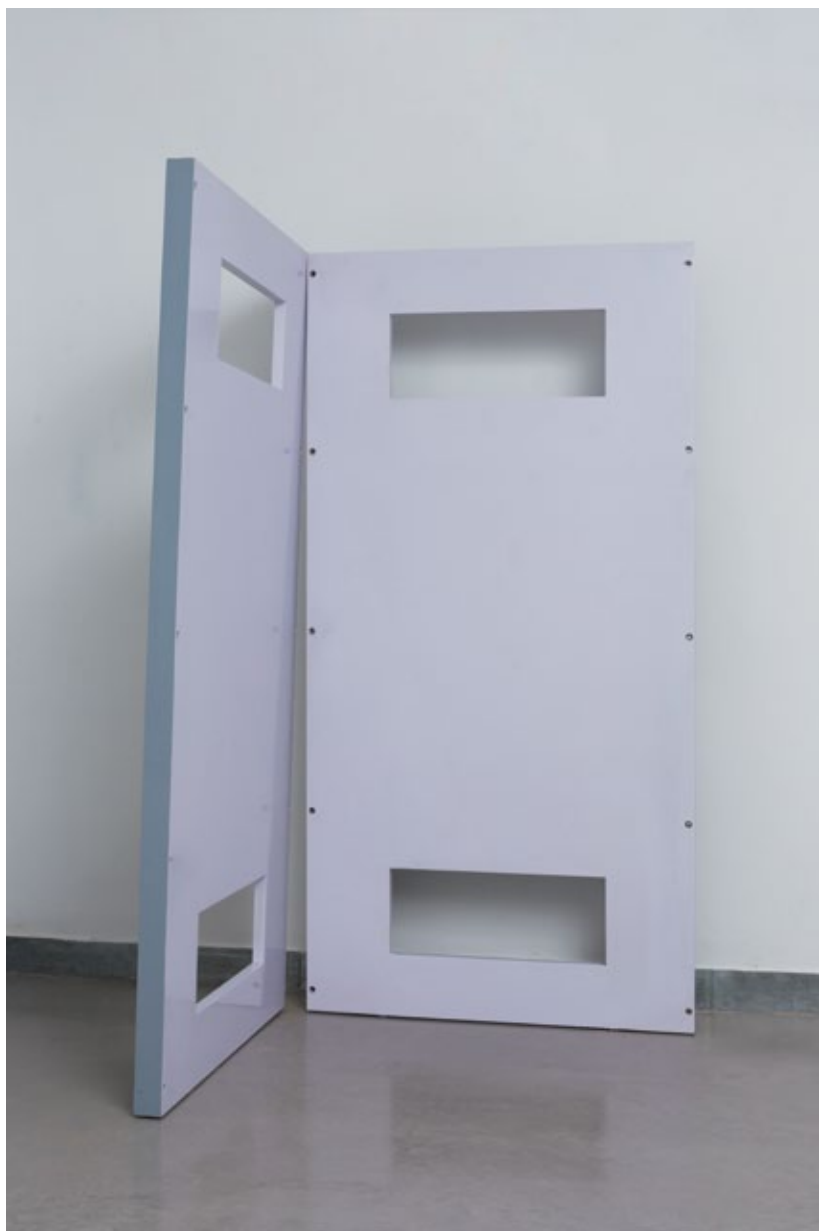
The Doors on the Way to the Department, 2015 Mixed media 6x120x175 cm