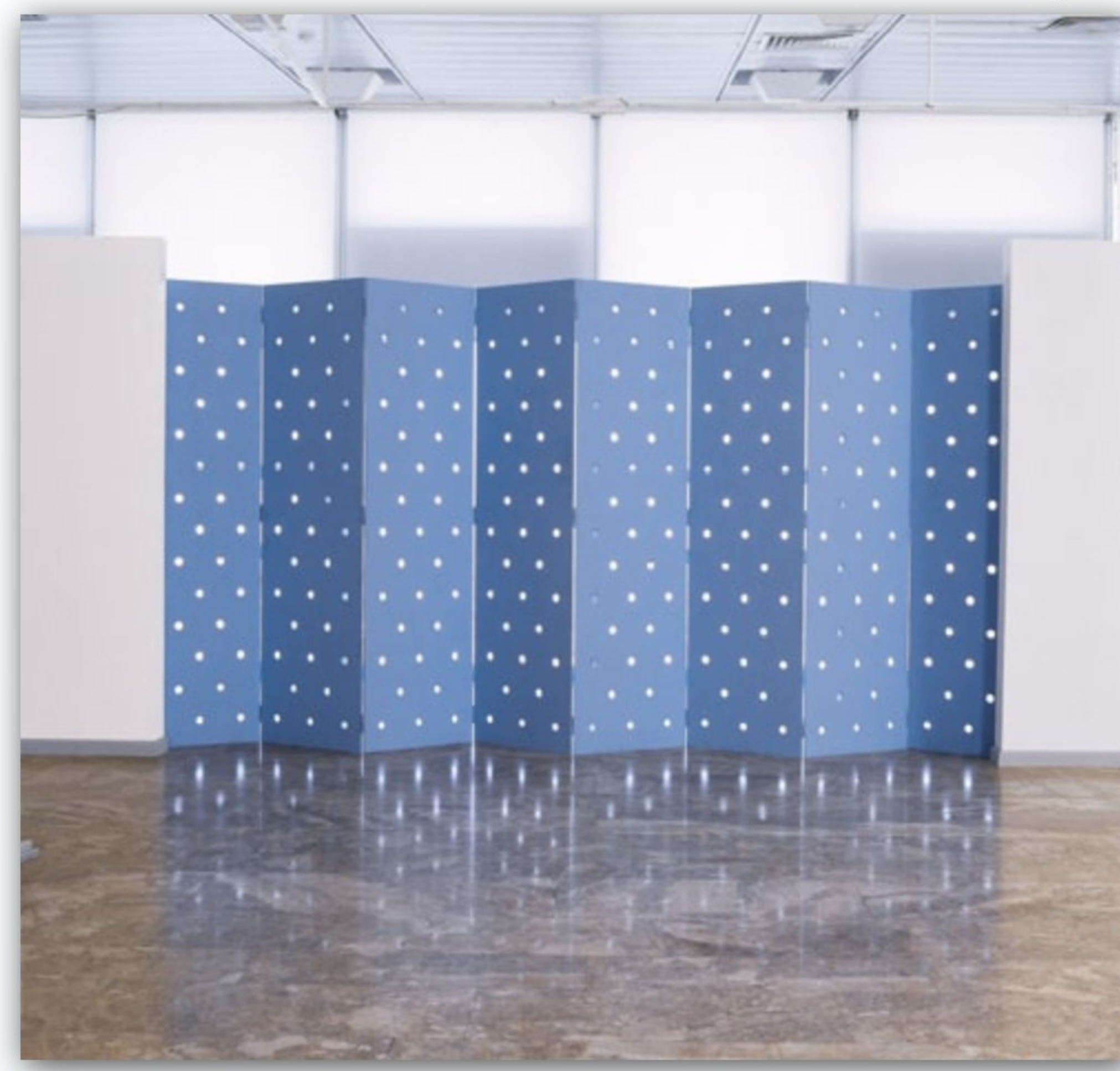
עמי רביב, "פרגוד", 2003

גוף, מיטה, שמיכה, מגבת, פרגוד, רמפה לכסא גלגלים, מחיצה, משוכה, מכשיר ספורט שיקומי, חלון, דלתות, גוף. זה מילון הדימויים הרוה במכוון שחיבר רביב. זה טווח התנועה שלו. אחרי החולי, ומבנה בית החולים היחודי שהוא מיקרוקוסמוס, והמזור היחסי והשיבה למהלך החיים, ספורט הוא אפשרות.