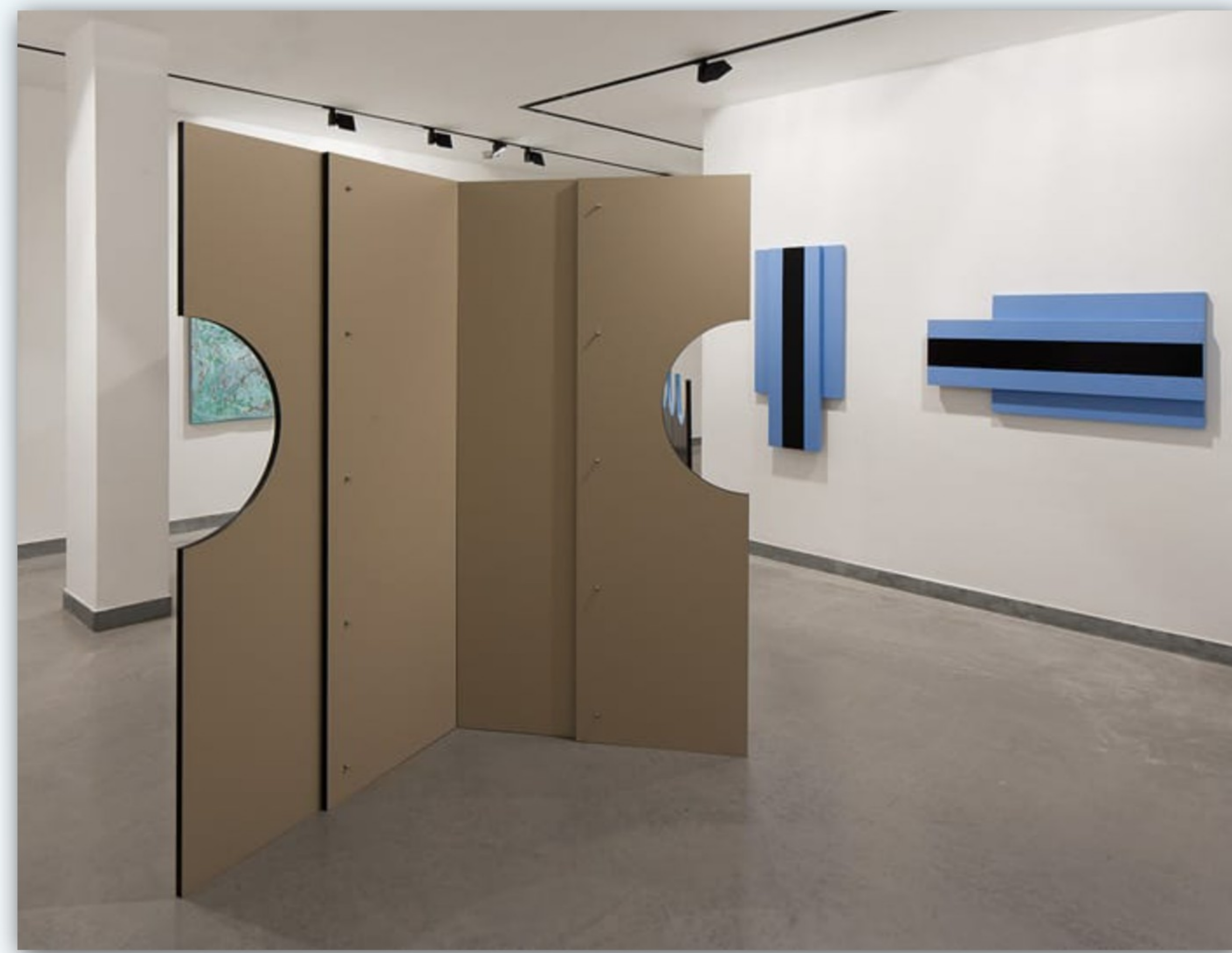
מראה הצבה מתוך התערוכה.

אלו כמובן מצבים מדומיינים, דחיסה של מקבץ משימות זמן-חלל שרווחות בסרטי פעולה ואולי במצבי קיצון, אבל לא בחיי היומיום. המשימות של רובנו רגע-רגע, יום-יום, פשוט בהרבה, מונטוניות, ועם זאת דורשות תגובה כמעט אינסטינקטיבית. למעשה ההתנהלות שלנו במרחב, האופן שבו אנו – אם נחשוב לרגע על הגוף שלנו במנותק מ"עצמנו" – נעים בעולם, כמעט שאינו דורש מחשבה. רגל אחרי רגל יורדים במדרגות. מתיישבים על סף המיטה ונשכבים. יד ימין מעבירה הילוך, יד שמאל מסובבת את ההגה. כף היד מטפלת בעדינות במפתח ואחר-כך בידית הדלת.